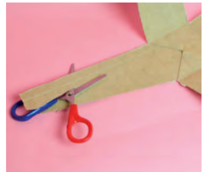
Steg 2-Rita & Klipp