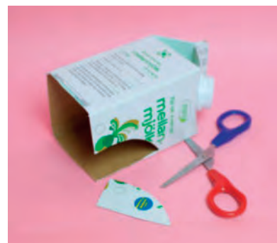
Steg 2- Klipp