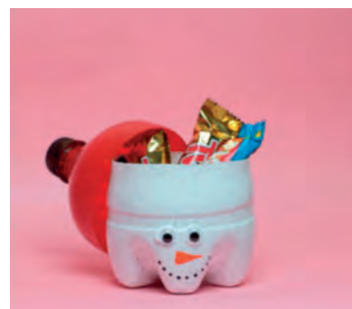
Steg 9- Varsågod!