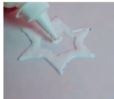
Steg 2-Spritsa lim