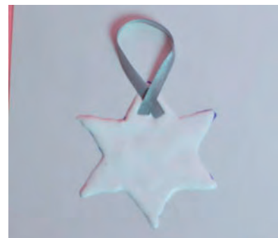
Steg 3-Lägg i snöre