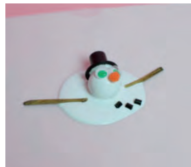
Steg 5-Lägg i pinnar