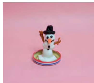
Steg 4-Bränn igen