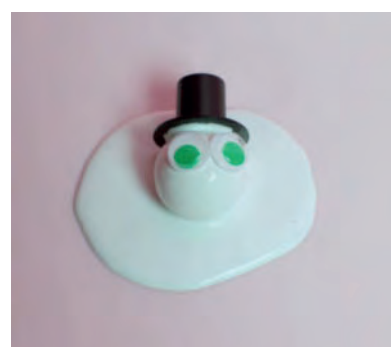
Steg 4- Lägg i hatt