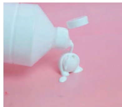
Steg 1-3 Häll färg