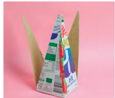
Steg 3-Tejpa ihop