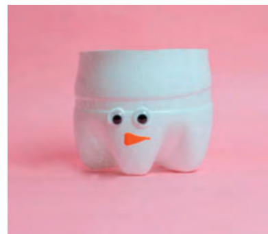
Steg 5-7: Öga, Näsa, Mun