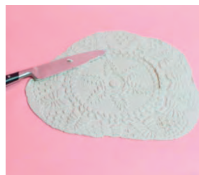
Steg 3-Skär ut cirkel