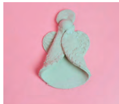
Steg 4,5,6- Forma