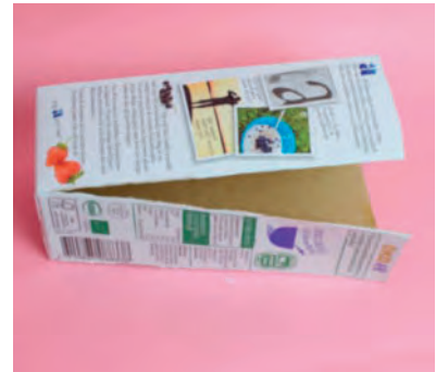
Steg 1-Klipp kanterna