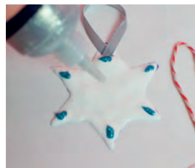
Steg 4-Glitter Gel