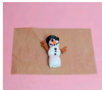
Steg 1-Forma figur