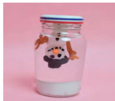
Steg 5-Skruva fast