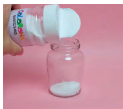
Steg 3-Häll i sand&vatten