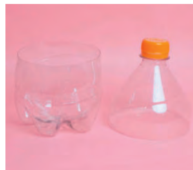
Steg 1 & 2-Klipp