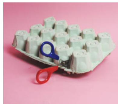
Steg 1-Klipp ut bottnar