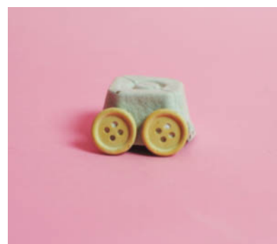
Steg 2- Limma fast däck