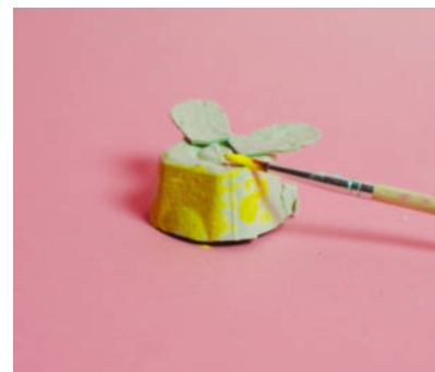
Steg 4-Måla getingen