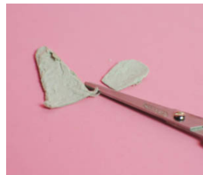
Steg 2-Klipp vingar