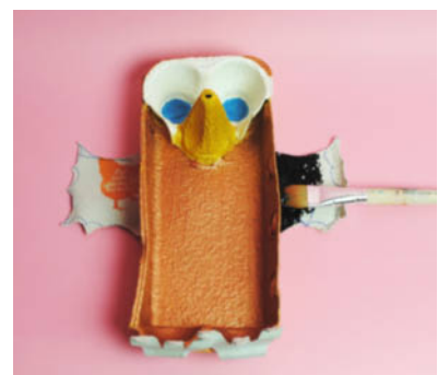
Steg 7 -Dekorera