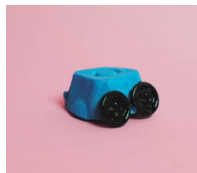
Steg 4-Måla däck