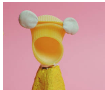
Steg 3-Forma öron