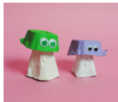
Steg 6 -Limma ögon