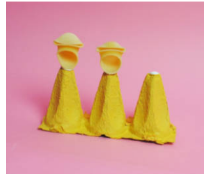
Steg 2-Limma pasta