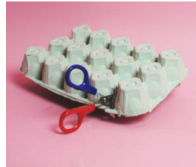
Steg 1-Klipp ut botten