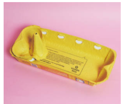
Steg 3 - Limma