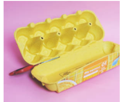
Steg 1- Klipp