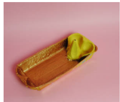
Steg 4- Måla