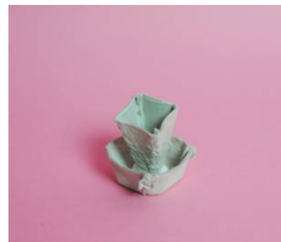
Steg 3 -Limma