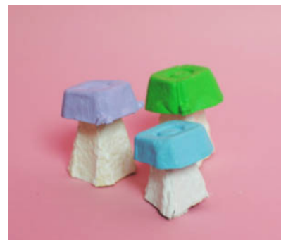
Steg 5 -Måla