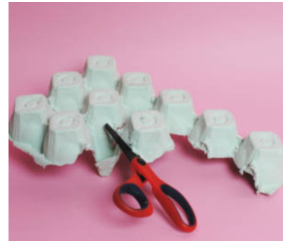
Steg 1- Klipp